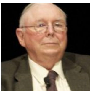
Charlie Munger, en 2010.

Warren Buffett estudió en la Universidad de Nebraska y después se matriculó en la Escuela de Empresariales de Columbia con el propósito de aprender del inversor Benjamin Graham . Buffett fue un alumno ejemplar; de tal manera que Graham lo fichó inmediatamente para trabajar con él. Buffett se independizó al poco tiempo. En 1959, Buffett conoció en una cena a Charlie Munger, también oriundo de Omaha. Desde entonces trabajan juntos. Hoy Buffett tiene 93 años y Munger 99, pero siguen en activo.