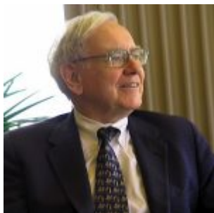
Warren Buffett, en 2005.

Warren Buffett estudió en la Universidad de Nebraska y después se matriculó en la Escuela de Empresariales de Columbia con el propósito de aprender del inversor Benjamin Graham . Buffett fue un alumno ejemplar; de tal manera que Graham lo fichó inmediatamente para trabajar con él. Buffett se independizó al poco tiempo. En 1959, Buffett conoció en una cena a Charlie Munger, también oriundo de Omaha. Desde entonces trabajan juntos. Hoy Buffett tiene 93 años y Munger 99, pero siguen en activo.