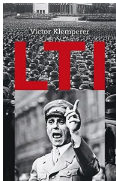
Victor Klemperer: «LTI. La lengua del Tercer Reich» (versión original alemana, con Joseph Goebbels en la portada)

Es más, para el nacionalsocialismo, los «héroes» y los «virtuosos» eran justo los fanáticos. «Si alguien dice una y otra vez fanático en vez de heroico y virtuoso , creará finalmente que, en efecto, un fanático es un héroe virtuoso y que sin fanatismo no se puede ser héroe. Las palabras fanático y fanatismo no fueron inventadas por el Tercer Reich; este solo modificó su valor y las utilizaba más en un solo día que otros épocas en varios años» (pp. 31-32).