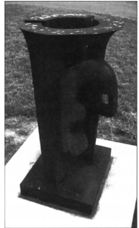
Aizkorbe, Columna en transformación , 1992.