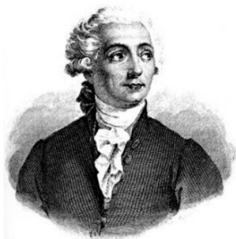
Antoine Lavoisier, considerado el padre de la química moderna

Son muchos los químicos que podríamos evocar con este motivo. Pero nos vamos a limitar a dos, que son: Antoine Lavoisier y Dmitri Mendeléyev. El primero es considerado como el padre de esta ciencia. Nació en París en 1743 y fue guillotinado cuando tenía 50 años, en 1794. Elegido miembro de la Academia de Ciencias, ocupó diversos cargos públicos, como los de director estatal de los trabajos para la fabricación de la pólvora, comisario del tesoro y miembro de una comisión para establecer un sistema uniforme de pesas. Trató de introducir reformas tanto en los sistemas monetario y tributario como en los métodos de producción agrícola. Investigó la contaminación del agua y realizó experimentos que proporcionaron pruebas para la ley de la conservación de la materia. Concibió una nomenclatura química como sistema de nombres, que sirve de base al sistema actual. En 1789 publicó un Tratado elemental de Química, donde definió el concepto de elemento como una sustancia simple, que no se puede dividir mediante ningún método de análisis químico conocido. En consecuencia, elaboró una teoría de la formación de compuestos.