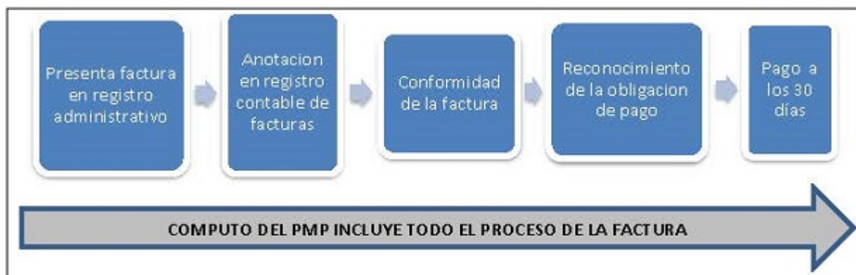
Gráfico 2: Criterio legal