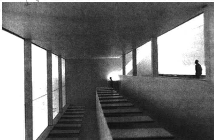
Alberto Campo Baeza, Biblioteca de la Universidad de Alicante

Las partes segunda y tercera del libro («Sobre Arquitectos» y «Sobre Obras de Arquitectura») han sido dictadas por la cabeza en muchos casos y, además, por el corazón en muchos otros. Pero querría destacar aquí el hecho de que más de la mitad de los textos que se recogen en este libro están dedicados a hablar de otros arquitectos distintos de él mismo y de otras obras distintas de las suyas, muy dispares entre sí. Esto nos lleva a una doble conclusión: primero, el demostrado interés del autor por una visión heterodoxa de las obras de Arquitectura y de los arquitectos y, segundo, que este interés es independiente de la edad y del lugar de procedencia del autor y de las obras.