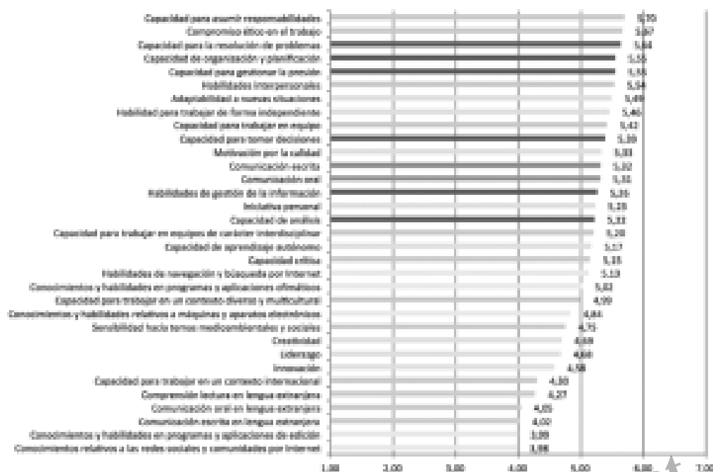
Tabla 2. Nivel de competencias requerido en el último empleo, tras cinco años del egreso.

¿Existe un desajuste entre las competencias que los titulados adquieren en la universidad y las que demandan los empleadores?