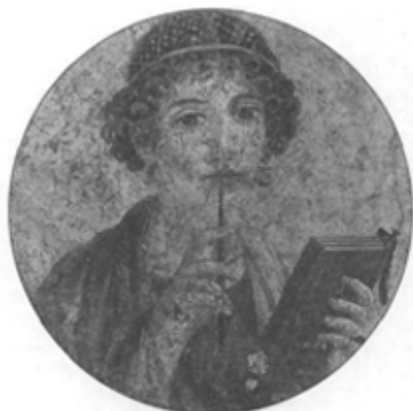
Tonda con retrato de mujer escritora, hallado en Herculano. Museo Nacional de Nápoles.

Los retratos de El Fayum no surgieron de la nada, sino que tomaron como base la retratística pictórica romana. En efecto, sabemos que había cuadros de este género —evocaciones de los dueños de la casa, o de familiares suyos— adornando ambientes domésticos, tal como documentan algunos frescos pompeyanos. Baste recordar, en este sentido, el tondo con retrato de una mujer escritora que conserva el Museo de Nápoles o el freco aparecido en el sector VII.2,6 de Pompeya con la efigie de un matrimonio. En ambos casos, como en los retratos grecoegipcios, el modelo nos contempla, pero la cabeza y el cuello modelan un mínimo escorzo para evitar una frontalidad absoluta. La misma actitud mostraban, según podemos entrever, los retratos pictóricos que animaban los muros de ciertas tumbas. Alguno de ellos, fechable como los anteriores en el siglo I d.C. nos ha llegado, aunque muy destruido, la propia Roma.