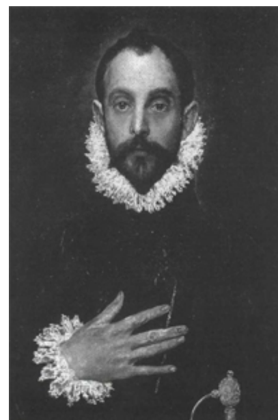
El Greco, El Caballero de la mano en el pecho (detalle), 1580, Madrid, Museo del Prado.

En tales circunstancias, incluso a mí me resulta tentador volver al desafío que Tormo y Mélida lanzaron, y que no supieron superar de forma convincente. Es posible —creemos— salir hoy mejor parados que ellos, por la sencilla razón de que nuestros conocimientos sobre el arte antiguo y medieval son mayores que los de hace un siglo. En la actualidad, por ejemplo y sin ir más lejos, nadie suscribiría—tras los descubrimientos de las tumbas de Macedonia— las ideas de Mélida acerca de la pobreza de la pintura clásica griega, ni se sorprendería, como él, ante el desarrollo del retrato como género artístico en la Hélade.