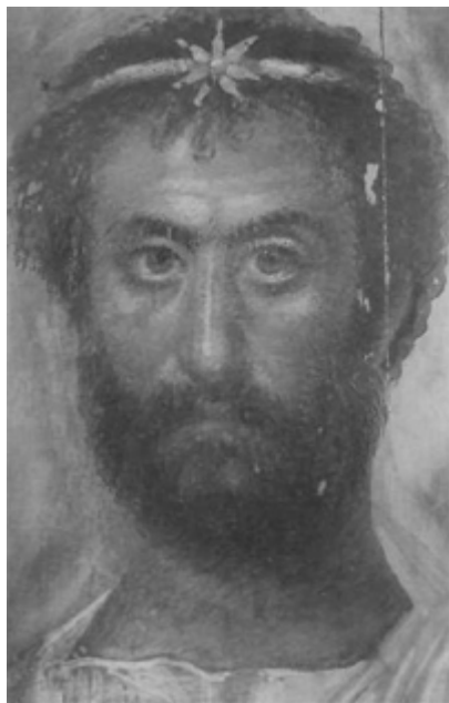
Retrato de un sacerdote de Serapis, hallado en Hawara, 140-160 d.C Museo Británico

En una primera fase —hasta la muerte de Vespasiano (79 d. C), poco más o menos—, asistimos al desarrollo de una retratística «clásica». Los artistas, directamente vinculados a través de Alejandría con las escuelas de todo el Imperio —Roma, Atenas, Pompeya— construyen facciones tranquilas, algo ideales, con miradas directas y caras ovaladas. Prácticamente no hay nada en esas efigies que sugiera la presencia, próxima o lejana, de la muerte. Tampoco caben fisuras en la calidad artística: todas las obras son correctas, aristocráticas y modeladas con múltiples matices.