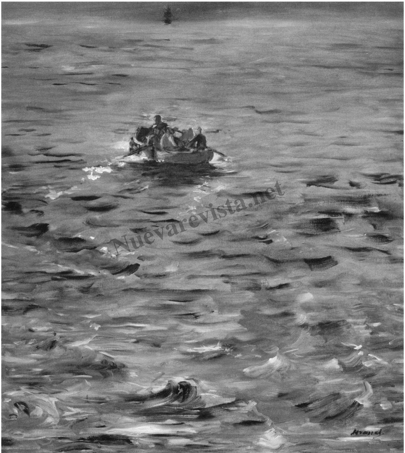
Édouard Manet, La evasión de Rochefort , ca. 1881. París, Musée d'Orsay

impresionistas. Aunque su pintura está centrada preferentemente en la figura humana, como sucede en su famoso El pífano (1866), eso no quita para que nos sorprenda en esta exposición con, por ejemplo, La evasión de Rochefort (1881), obra centrada en un paisaje marino de espléndida factura.