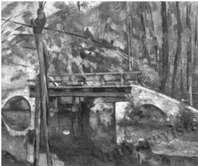
Paul Cézanne, Puente de Maincy, ca. 1879. París, Musée d'Orsay

representante, capaz de superar el puro impresionismo, llevándolo un paso más allá, fundamentalmente mediante la reconstrucción de las formas y la superposición de planos según la gradación de color, que hacen del lienzo como una pátina de conjuntadas tonalidades brillantes. «Cézanne no busca transmitir al observador la ilusión de un mundo tridimensional. Más bien crea una nueva realidad a base de planos bidimensionales de la imagen», se ha dicho con acierto. Y todo esto se observa en el Puente de Maincy (1879), obra admirable en todos los sentidos. Y también se aprecia, de una u otra manera, en su Autorretrato con fondo rosa (1875), obra igualmente admirable.