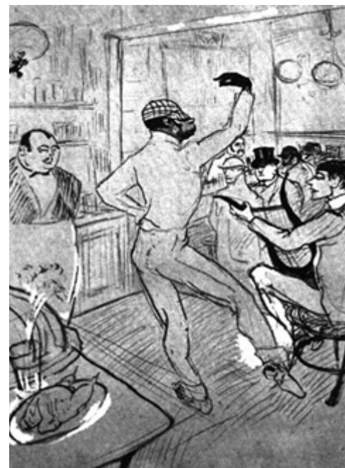
Toulouse-Lautrec, Chocolat bailando .

El Diario es, además, un prodigioso ejercicio de escultura de la palabra, al estar cinceladas las frases gracias a un lenguaje en estado de pureza. Domina la economía de estilo, y esto no es aquí un mero tópico que alude a la claridad de las formas. Se aleja el inclasificable Renard de toda grandilocuencia, aunque el equilibrio y la concisión de muchos de sus hallazgos recuerdan el aliento de las punzadas líricas. Incluso son evidentes las posibles analogías con autores que cultivan el fognazo del ingenio, caso de las greguerías de Ramón. Este cultivo del ingenio es el resultado también de una incapacidad. El ingenio como simulacro de la falta de vis creadora. No lo sostiene una verdadera pasión creadora. Una de las grandes vetas de este maravilloso centón es, entre tantas otras, la dialéctica trazada entre el talento y el ingenio, dentro del contexto de la relación entre la sociedad y sus reclamos y la soledad del artista puro. Detrás de los dilemas sólo aparece de modo entrañable la incapacidad de Renard para la creación que tanto añora.