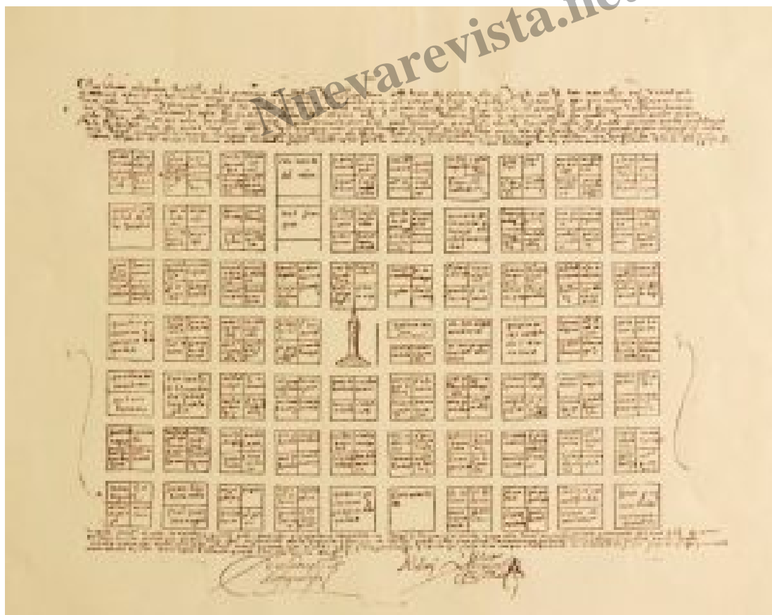
Primer trazado de la ciudad de Córdoba en 1577 por Lorenzo Suárez de Figueroa.

En 1577 Lorenzo Suárez de Figueroa trasladó sus escasos pobladores al actual emplazamiento, demarcando las 70 manzanas que la formaron[2].