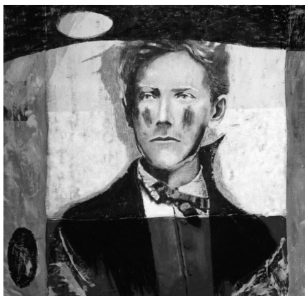
Arthur Rimbaud, «Obra completa bilingüe»